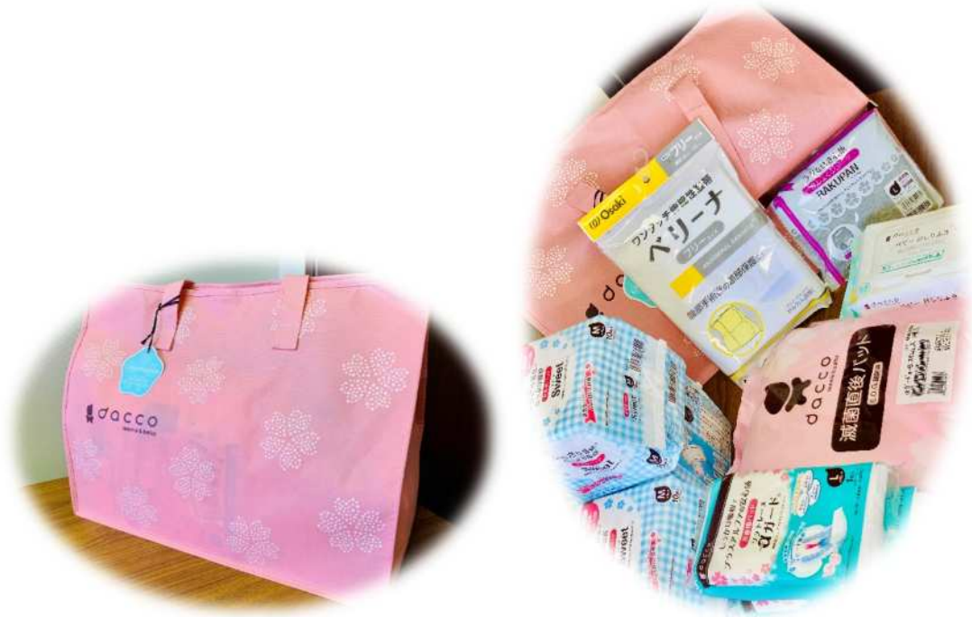
お産バッグ（経膣分娩）