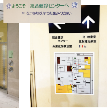
つきあたりが総合健診センター入口です