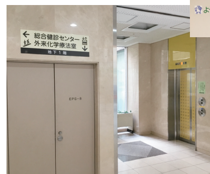
1階総合案内横のエレベーターから地下1階に降ります